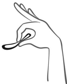
Rycina 2 Ścisnąć system