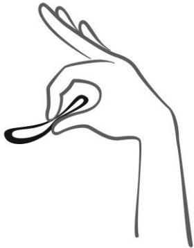
Rycina 2. Ścisnąć system