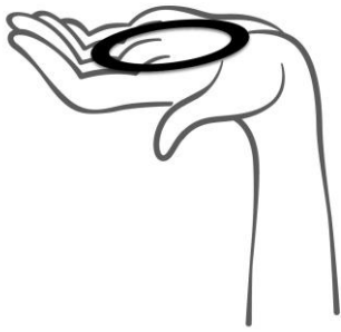
Rycina 1. Wyjąć system Ginoring z saszetki